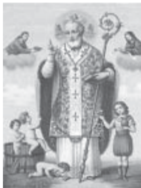
San Nicolás de Myra o de Bari

puesto que el anterior había fallecido. Finalmente determinaron que: “elegiremos al próximo sacerdote que entre al templo”. Y, en ese momento, ignorante de la determinación, ingresó Nicolás y por aclamación de todos fue elegido obispo. Y es por ello que se lo conoce en la actualidad como San Nicolás de Myra. Gracias al cariño que dispensaba a los chicos y a su gran generosidad, que le hizo donar toda su fortuna personal, recibió el nombre de “Obispo de los niños”. Semejante acto lo popularizó al extremo de hacerle trascender las fronteras y de que se crearan innumerables leyendas sobre su persona, las que relataban desde salidas nocturnas para repartir regalos entre quienes lo necesitaban hasta milagros como el de sosegar una tempestad y resucitar a un marinero egipcio.