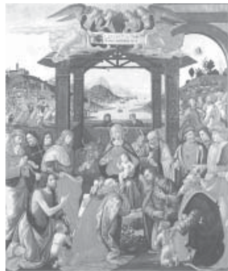
La Adoración de los Reyes por Domenico Ghirlandaio

Los orientales llamaban magos a sus doctores. Para los persas, mago significa "sacerdote". Más tarde, la tradición les llamó "reyes".